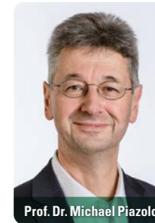
Prof. Dr. Michael Piazzolo